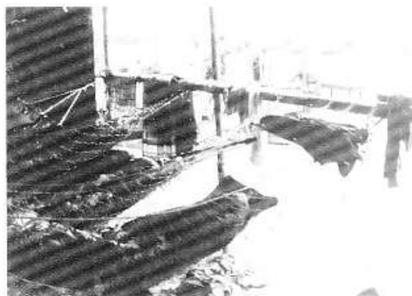
Senior-underlejr til divisionslejr 1983.

ment med 80-100 deltagere fra troppene i Silkeborg, Sejs og Galten. Nordpolfæerden er et natte-løb der strækker sig over en 15-20 km og foregår i slutningen af januar, bygget op omkring en historie med Rødfrakker, indianere, pelsjægere, smuglere m.m.