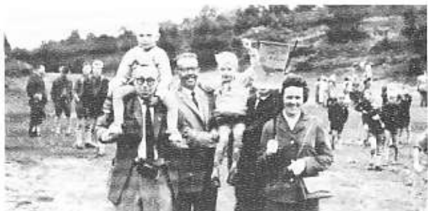
Sommerlejr fest på Ryekol.

På hver sommerlejr lavede vi et navneskind, hvorpå alle deltagende spejdere og førere skrev deres navne. - Disse skind kan endnu ses i lokalet på Lyngbygade.