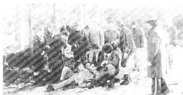
Nordpolfæerden 1981 er slut.

For os vil det i høj grad betyde at spejderen skal udvikle sin egen selvstændighed med spejderarbejdet.