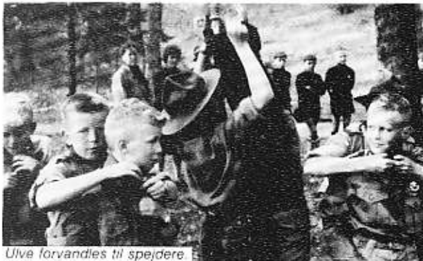
Ulve forvandles til spejdere.

Troppens stander bærer præg af disse konkurrencer. Den bedste trop i det samlede resultat fik overrakt rævehalen - det har vi også prøvet!