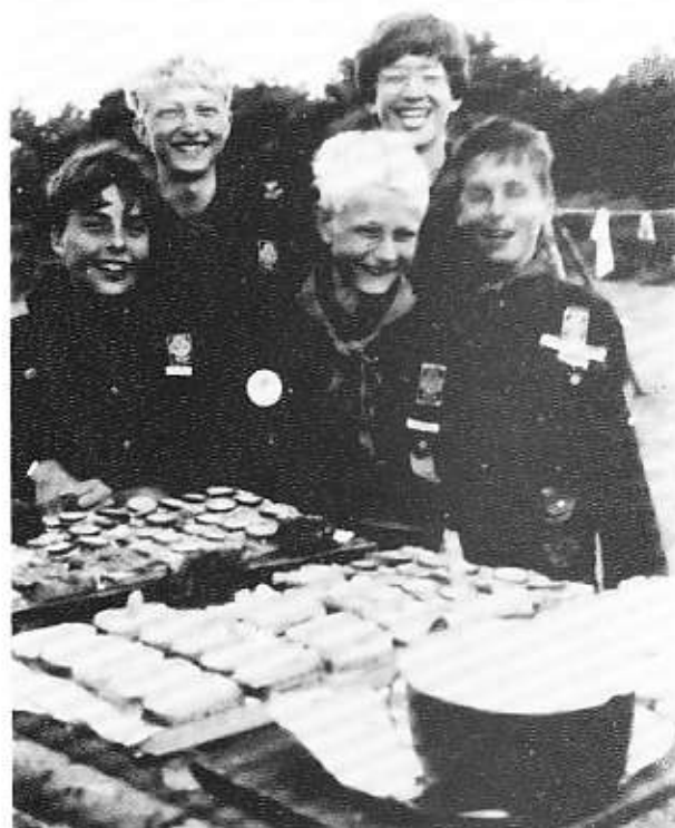
Så "skaffes" der.

Det er måske et spørgsmål om demokratiseringen, hvis vi bruger denne terminologi for at beskrive udviklingen, ikke registreres meget hurtigt i spejdersammenhæng, det finder jeg ofte er tilfældet. - Den arbejdsform og de midler, der op gennem 70'erne blev indført i mange spejdergrupper og måske navnlig i korpsets ledelse, hvor man, vel af mangel på kvalificerede ledere, eller dårligt uddannede ledere, fik indført en, lad os kalde det "pæda-