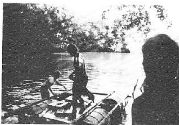
Til søs på tømmertåle v/ Åkrogen.

Grupperådet, der er gruppens højeste myndighed holder normalt et årligt møde i februar.