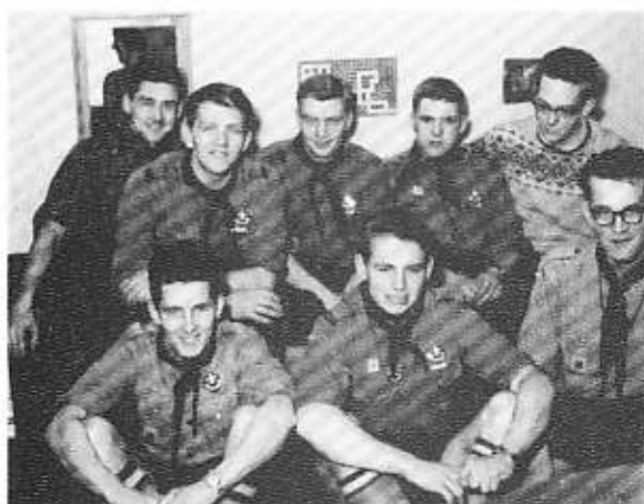
Billedet, der startede minderne.

Et tilbud om at få lov til at skrive i vor gamle trops JUBI-SPUL kan jeg ikke lade gå fra mig - hvem vil ikke gerne fortælle om noget, der har haft så stor betydning i ens liv, som det at være spejder i 1. Silkeborg? - Så jeg tager fat.