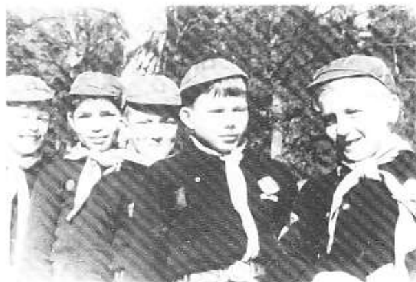
Ulvemøde anno 1950.

Næste punkt på programmet er vores junglebogshistorie, som vi af og til afbryder for at give ekstra forklaringer eller snakke om noget, som har relation til det, vi laver.