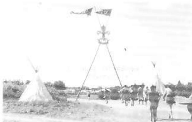
Jubilæumsfejre 1960 v/ Ebeltoft.

Efter paraden var der ofte ulveoprykning.